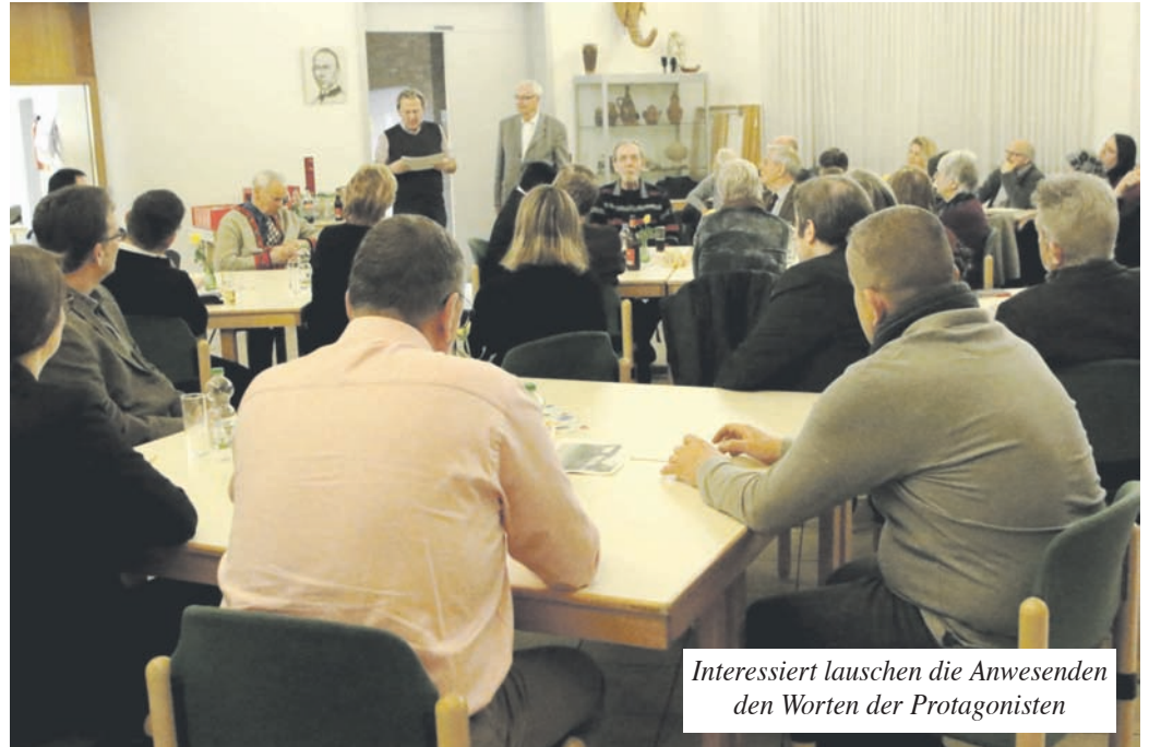
Interessiert lauschen die Anwesenden den Worten der Protagonisten

Nachdem sich vor vier Jahren viele Interessenten für eine Mitarbeit gemeldet hatten, ist die Zahl der Mitarbeiter/innen mo-